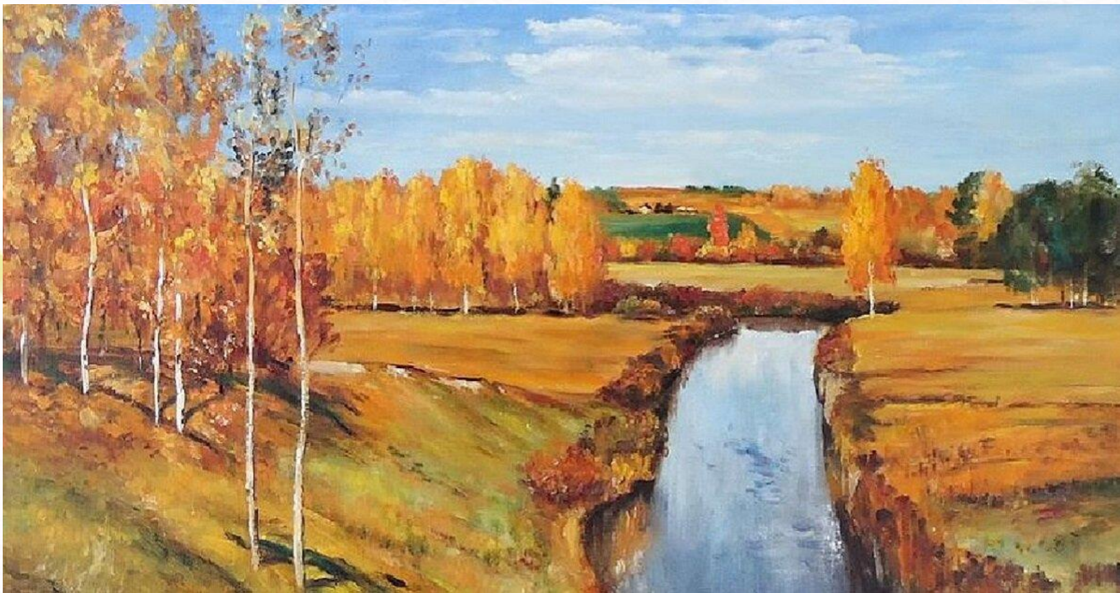
И.Левитан «Золотая осень»