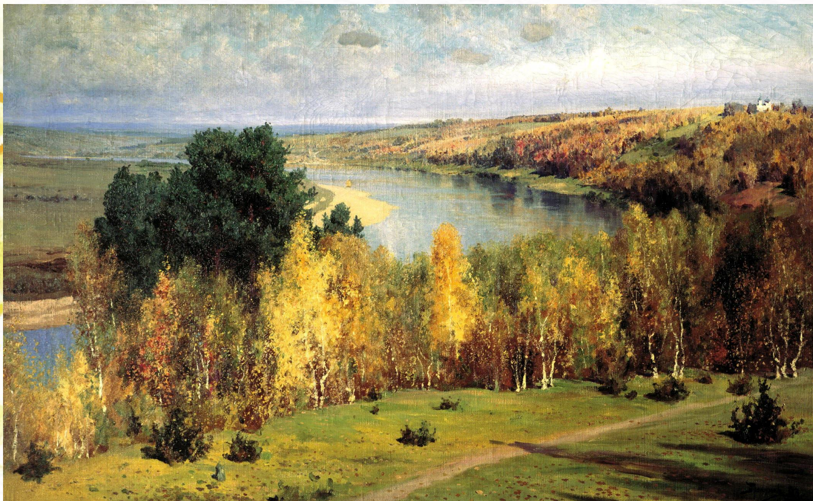
Василий Поленов «Золотая осень»