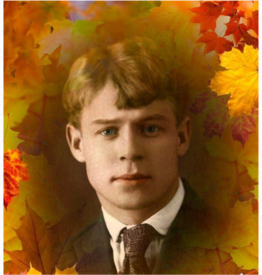
Сергей Александрович Есенин